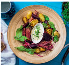
10. Rusztikus céklasaláta ropogós csülökkel

Vadak az őszi erdőből • Szüreti ételek • Itt a gombaszazon Édes szörnyecskék • Diós, mandulás desszertek