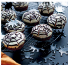
31. Kávés pókhálómuffin