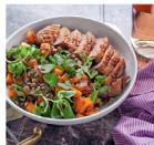
18. Libamell őszi lencsesalátával